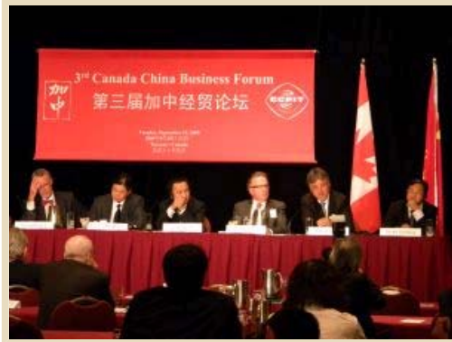
論壇CEO圓桌會議由中加雙方企業高管介紹經驗。本報記者攝